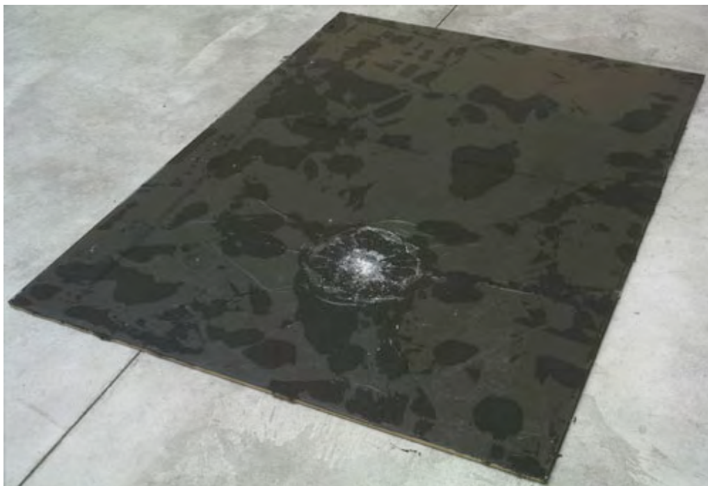
JIMMIE DURHAM Stone (removed) on glass